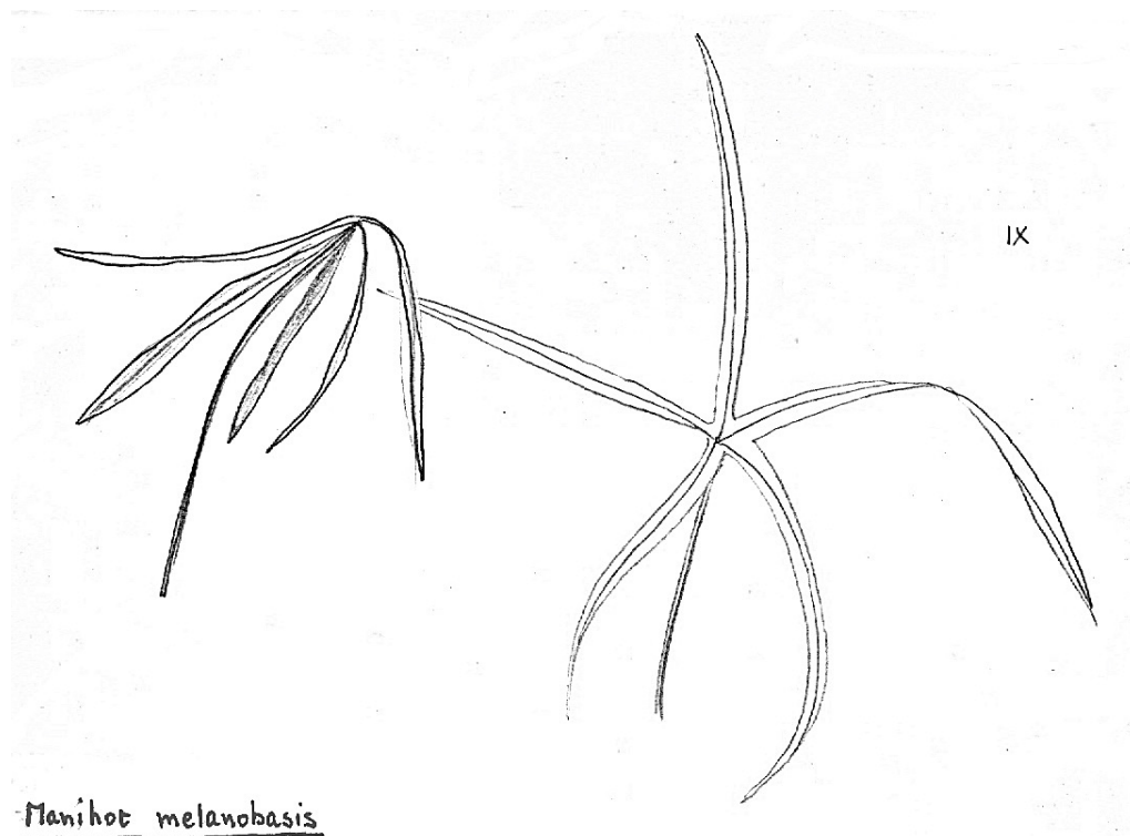
Wilde cassave. Tekening R. Norde uit SIPTEK.

13 Jan. lopen zij in Zuidelijke richting naar de grote savanne, die gebrand is en er zwart en verkoold bij ligt. De savanne is bedekt met kleine heuvels die de Indianen Kontáni noemen. Boven op deze heuvels groeit de wilde cassave,