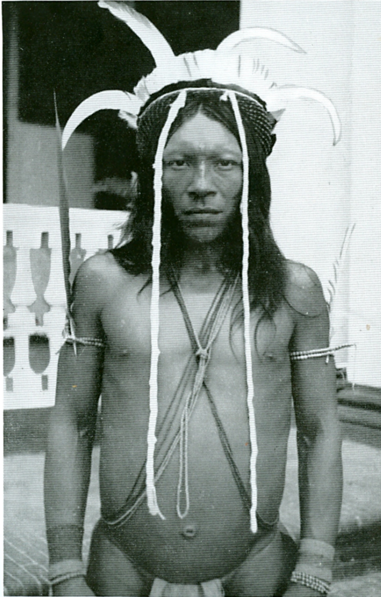
DE OAJANA KAPITEIN JANEMALE VAN DE LITANI

13 Nov. zijn ze al terug in het Koele-koele kamp en op 18 nov. komen ze in Yanemale-kondre aan.