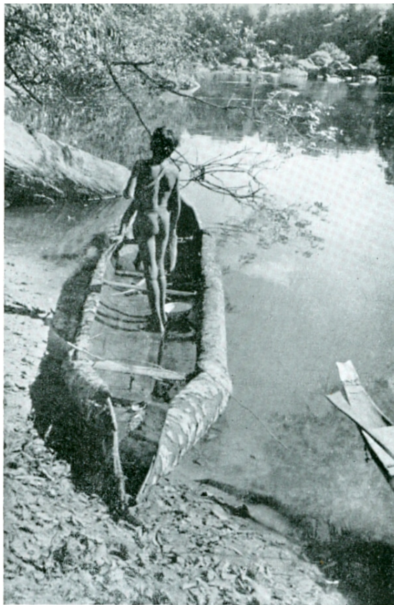
Schorsboot met Trio-Indiaan